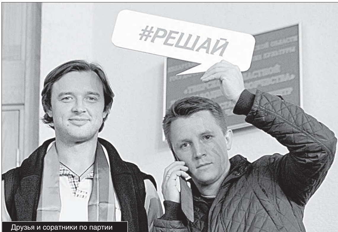
Друзья и соратники по партии

— Бюджетный комитет возглавляет ваш коллега по партии. Как, собственно, и все другие комитеты. То, что у вас большинство в Думе не отражается на ра-